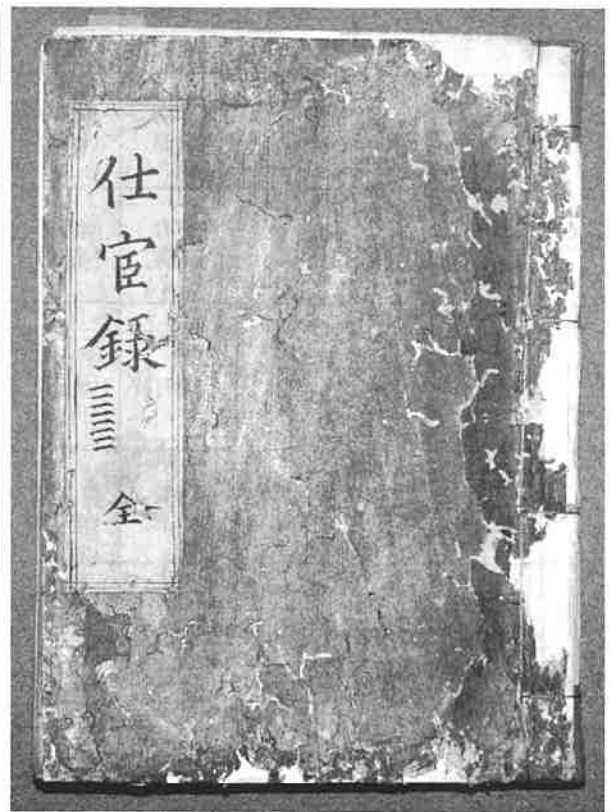
関宿藩旧家老亀井家仕宦録 (千葉県立関宿城博物館保管 個人蔵)